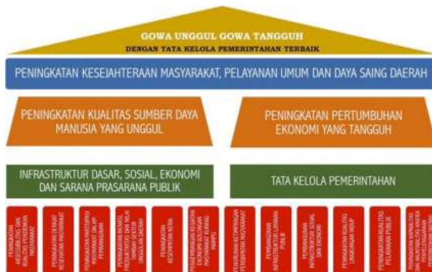
Gambar 2 1 Pilar Pembangunan Kabupaten Gowa